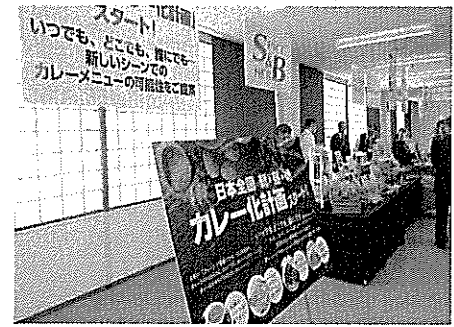
入り口のボードに「日本全国カレー化計画」

「セレクトブランド」も拡充 ▽トッピングカレーペースト、肉・魚などの主菜ソースやサラダなど副菜用にも使える便利なチユーポトル入りカレーペースト。焼き鳥や和え物、ドリア、焼き魚などにも便利。「日本全国カレー化計画」の「純菜（ビーガン）」に当たる認証マークを取得。飲料用にも使える「トッピングカレーペースト」も拡充