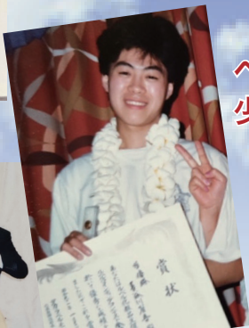
全国大会準優勝の時の写真