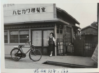
昭和39年に2代目が開業したときの写真