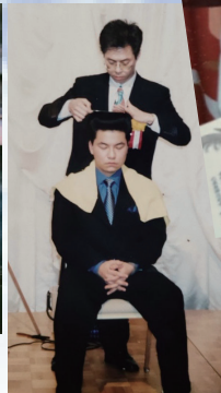
全国大会で入賞した時のデモンストレーション