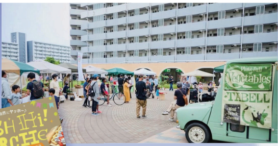
サロン前の広場で開催したヴィーガンマルシェ