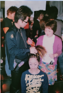
渋谷のクラブでのヘアショー